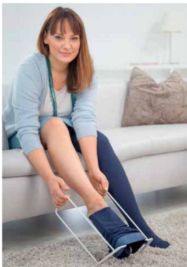
tnx. Im medizinischen Fachhandel gibt es spezielle An- und Ausziehhilfen (medi Butler), die den Umgang mit Kompressionsstrümpfen vereinfachen.

tnx. Medizinische Kompressionsstrümpfe sind die Basistherapie bei Venen- und Ödemleiden. Der Arzt kann sie bei medizinischer Notwendigkeit verordnen. Wichtig: die Strümpfe sollten regelmäßig getragen werden. Wem es schwer fällt, die enganliegenden Kompressionsstrümpfe anzuziehen, kann ein Hilfsgerät wie den medi Butler nutzen. Vor allem für Venen- und Ödem-Patienten, die in ihrer Kraft und Beweglichkeit eingeschränkt sind, bieten die Anziehhilfen eine wesentliche Erleichterung. Der Strumpf wird über den Einstiegsbügel gezogen und so bereits vorgedehnt. Das erleichtert den Einstieg in den Strumpf, er gleitet einfacher über die Ferse. Anschließend wird der Kompressionsstrumpf an den Handgriffen mit leichtem Zug schrittweise bis zum Knie gestreift. Es gibt unterschiedliche Varianten, auch für Armstrümpfe und Strumpfhosen sowie eine Ausziehhilfe (medi Butler Off). Im medizinischen Fachhandel wie dem Sanitätshaus kann man sich zur geeigneten Ausführung beraten lassen. Bei Arthrose, Hüft- oder Kniegelenkversteifung und weiteren Krankheitsbildern kann der Arzt die praktischen Anziehhilfen auch verschreiben.